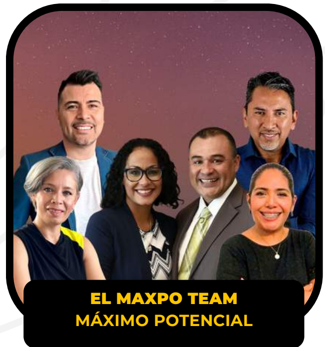
EL MAXPO TEAM MÁXIMO POTENCIAL

Viven en Post Falls, Idaho, y sirven como pastores y administradores del Discipulado Internacional ayudando a las personas de todo el mundo a ser y hacer discípulos de Jesús.